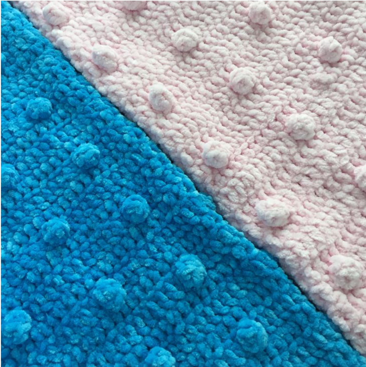
Designet af: Aslan design (Nasli Aslan)