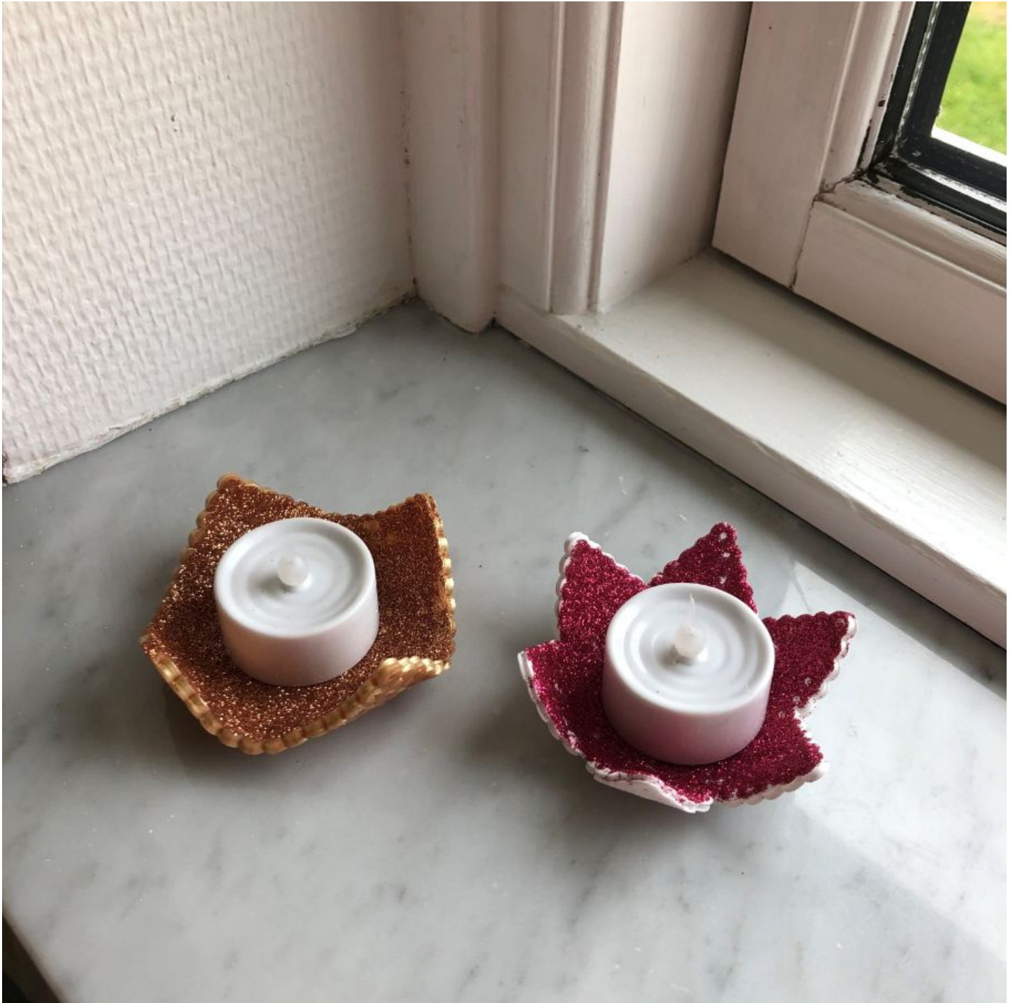
Designet af: Kreatosse (Majken Andreasen)